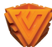
Original 90 x 65 mm

Druckaufträge. Der SOL PRO ist kompakt gebaut und nutzt eine Kombination aus Lasertriangulation und Weißlichttechnologie und erreicht eine Erfassungsgenauigkeit von 0,05 mm.